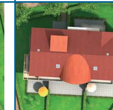
Résidence Le Chardon