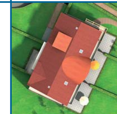
Résidence Le Trélod