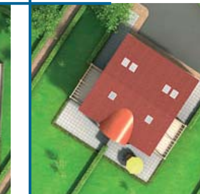
Résidence La Belle Etoile