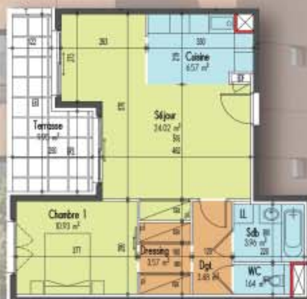
T2 d'une surface de 54 m 2