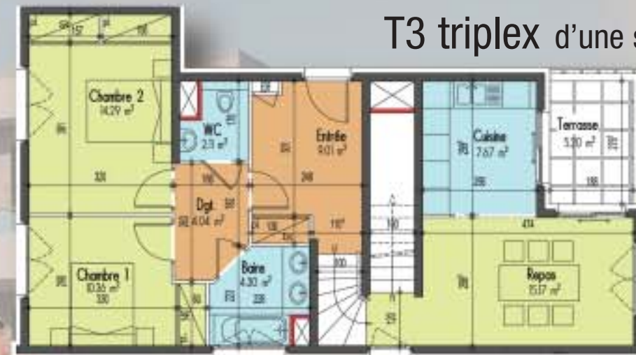
T3 triplex d'une surface de 91 m 2